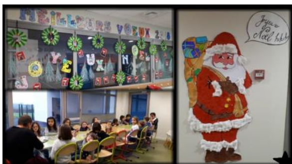
« Pour la période de Noël, les enfants ont participé à la décoration avec Sylvie et Séverine, pour terminer avec un très bon goûter. »