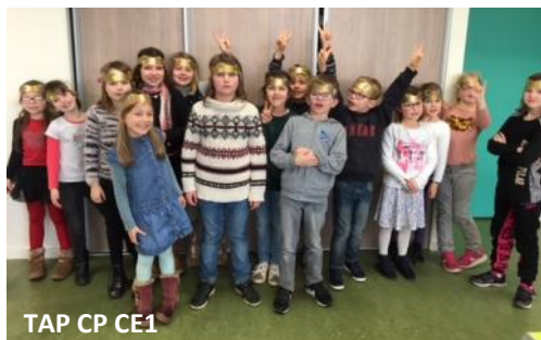
TAP CP CE1