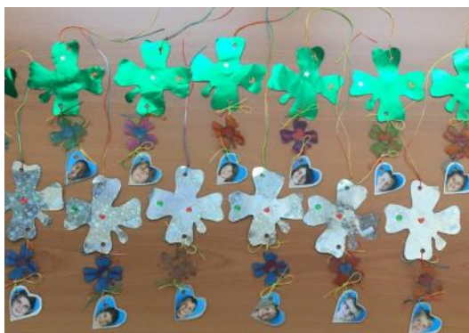
« Fête des parents en TAP CP/CE1 : les enfants étaient motivés en cette fin d'année »