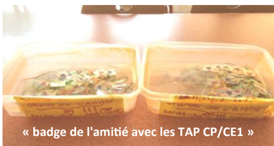
« badge de l'amitié avec les TAP CP/CE1 »