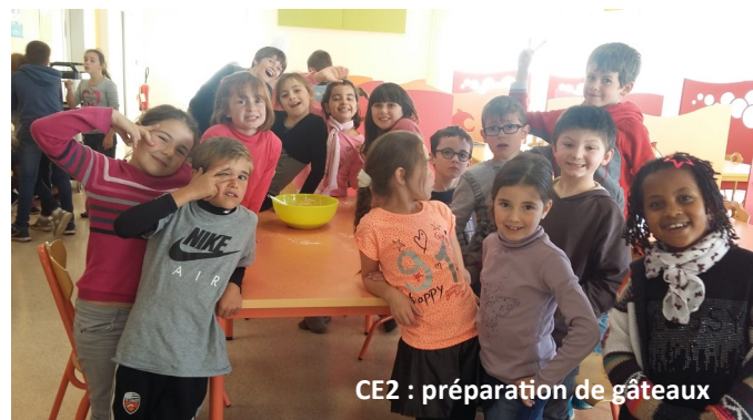
CE2 : préparation de gâteaux