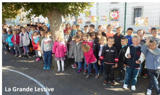
La Grande Lessive

La classe de Petite et moyenne sections a pu assister, vendredi 14 octobre, à un spectacle musical intitulé « Zouïe Zozeau » de Jean-Sébastien Richard, organisé par l'association Polysonnance. Ce moment de poésie sous-marine nous a emmenés à la rencontre de la baleine bleue, des méduses, des tableaux marins ponctués de chansons. A travers des jeux d'ombres, de lumières douces et poétiques, les élèves ont pu découvrir divers instruments de musique. C'était aussi l'occasion de prendre le car pour la première fois pour les plus petits ! Quelle belle première sortie scolaire !