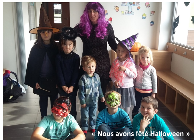
« Nous avons fêté Halloween »