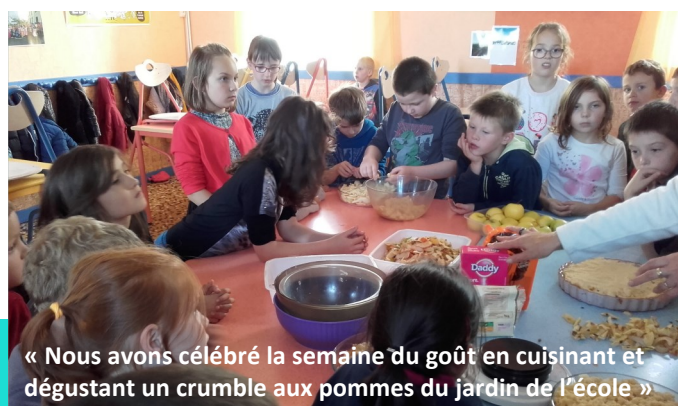
« Nous avons célébré la semaine du goût en cuisinant et dégustant un crumble aux pommes du jardin de l'école »