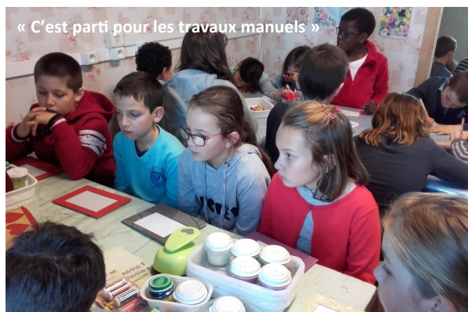
« C'est parti pour les travaux manuels »