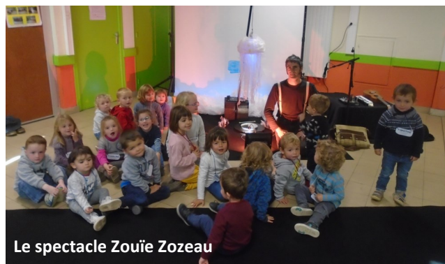
Le spectacle Zouïe Zozeau

La classe de Petite et moyenne sections a pu assister, vendredi 14 octobre, à un spectacle musical intitulé « Zouïe Zozeau » de Jean-Sébastien Richard, organisé par l'association Polysonnance. Ce moment de poésie sous-marine nous a emmenés à la rencontre de la baleine bleue, des méduses, des tableaux marins ponctués de chansons. A travers des jeux d'ombres, de lumières douces et poétiques, les élèves ont pu découvrir divers instruments de musique. C'était aussi l'occasion de prendre le car pour la première fois pour les plus petits ! Quelle belle première sortie scolaire !